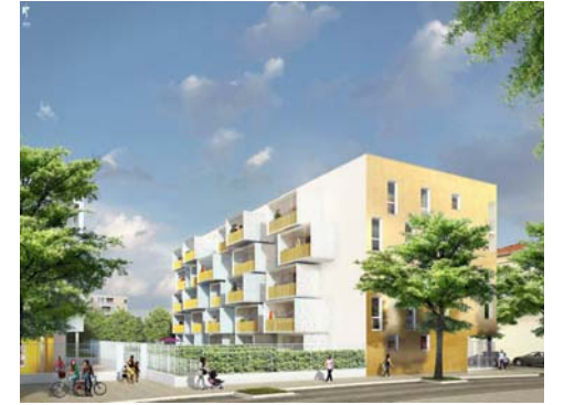
Avenue Marcel Paul