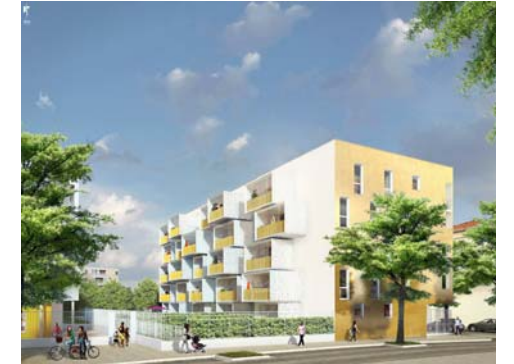
Avenue Marcel Paul